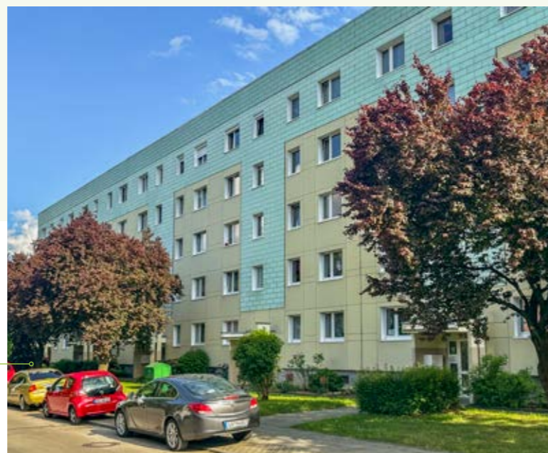
Unser Gebäude in der Otto-Grotewohl-Straße 11-17 vor (oben) und nach (unten) der Fassadenreinigung

Planungsstand: So könnte unser Gebäude in der Robert-Koch-Straße 5-9 nach der Fassadensanierung aussehen.