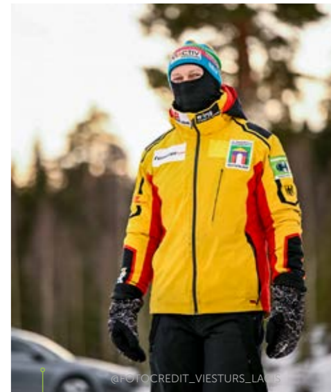
Olympiasieger und Weltmeister Francesco Friedrich (GER) gewinnt im Januar 2025 im Viererbob den IBSF Weltcup in St. Moritz.

Der Verein „Die Wohnungsbaugenossenschaften Deutschland“ ist ein Zusammenschluss von derzeit 429 Genossenschaften mit über 850.000 Wohnungen und mehr als einer Million Mitgliedern. Bundesweit organisiert in 43 regionalen Verbänden, steht der Verein für den Imageaufbau der Marke Wohnungsbaugenossenschaften und bietet darüber hinaus eine Plattform für den Austausch und die Zusammenarbeit seiner Mitglieder. Die GWG ist bereits seit 2008 aktives Mitglied dieser Initiative.