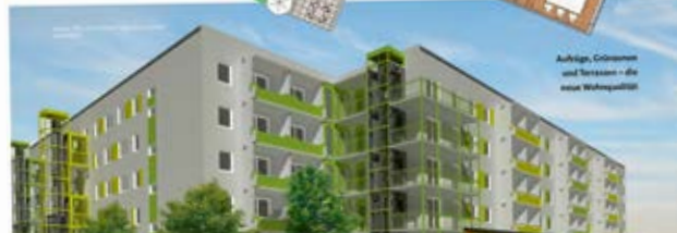
Aufzüge, Grünanlagen und Terrassen - die neue Wohnanlage!

Die „Komfortwohnanlage am Delphinbad“ wird das Leben in der Spreewaldstadt noch attraktiver und viele Möglichkeiten glücklich machen.