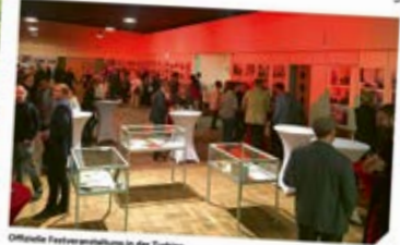
Offizielle Festveranstaltung in der Turbine

des beliebtesten Künstler-Duos aus der DDR, begleitete die GWG-Geschichte gar ein 24 Jahre lang und durfte darum auch nicht fehlen. „Best of Comedy“ als Genossenschaftler haben diese Aufgabe auch beachtlich gemeistert. Obwohl „Phel“ hier über etwas zu viel Oberbretter verfügte.