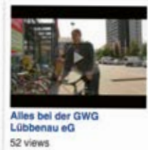
Alles bei der GWG Lübbenau eG 52 views

Wir als Genossenschaft sind eine große Gemeinschaft, die Freizeitsachen zusammen verbringt und Entscheidungen gemeinsam trifft. Ein reibungsloser, gemeinsamer Informationsaustausch ist dabei sehr wichtig. Presse, Journal und Webseite ermöglichen nicht immer einen aktuellen Stand. Aus diesem Grund hat der GWG Vorstand beschlossen, ein für Gemeinschaften optimiertes Werkzeug verstärkt zu nutzen: Die Internet-Plattform Facebook.